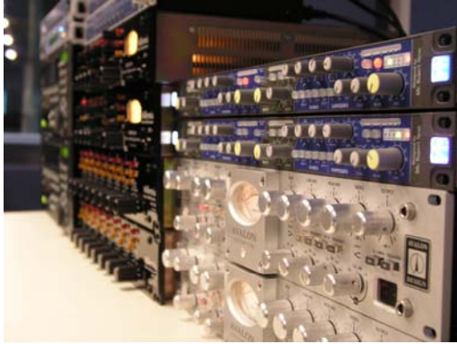
Εικόνα 2: Εξοπλισμός control room.

στη διάθεση μουσικών και ηχολήπτη για την πραγματοποίηση οποιασδήποτε παραγωγής (Εικόνα 2).